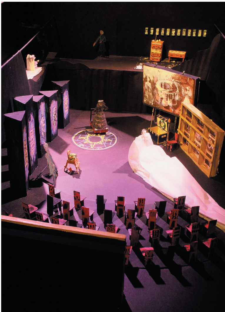
Fig. 10. Maquette pour 20 ans c'est pas rien