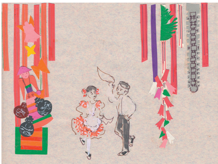
Fig. 5. Esquisse pour Add a Kezed (Donne-moi la main)

Il y a certes une autre caractéristique qui entre en jeu : le désir du retour pour retrouver les odeurs, les saveurs, les affections, la famille, la lumière, l'humus de nos racines. Dans certains de ces cas, à cause de l'impossi-