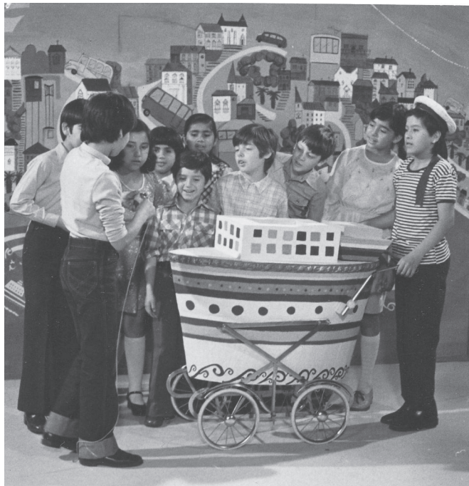
Fig. 4. Des enfants jouent pour l'émission Add a Kezed (Donne-moi la main)