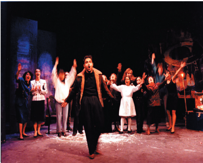
Fig. 11. Scène finale de 20 ans c'est pas rien