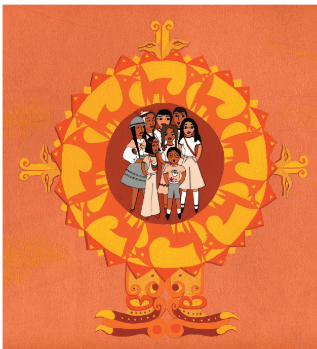
Fig. 8. Autre diagramme du film A Piros Kopive Virag (La Fleur copihue rouge)