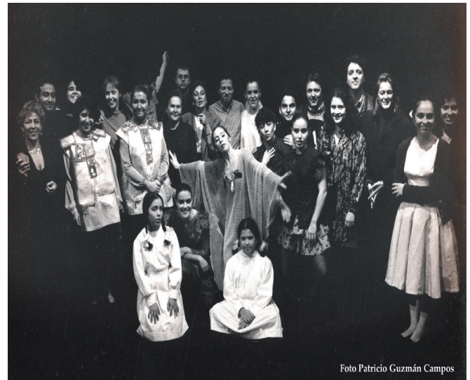
Fig. 12. Équipe de travail pour 20 ans c'est pas rien , composée de Chiliens et de Québécois