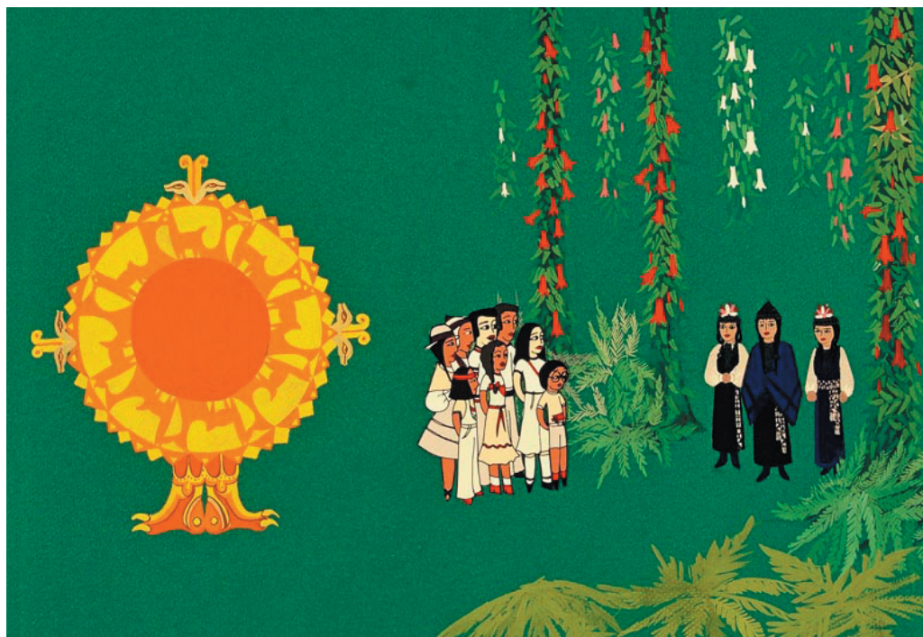
Fig. 7. Diagramme du film A Piros Kopive Virag (La Fleur copihue rouge)

« A Piros Kopive Virag », film d'animation de 8 minutes, reprenait la forme et la structure du voyage à travers le pays perdu, grâce à un voyage magique ou rêvé vers le pays d'origine. Un groupe d'enfants exilés voyagent vers la terre natale de leurs parents dans le but de trouver pour eux la fleur rouge appelée copihue ; ils ne connaissent, de cette terre natale, qu'une mystification allégorique construite à partir des récits de leurs parents. Les enfants doivent affronter quelques-uns des dangers auxquels certains de leurs parents furent confrontés pour finalement se retrouver devant les gardiens de la fleur convoitée et recevoir une triste réponse : la copihue rouge ne peut être arrachée de son terreau naturel, elle ne se transplante pas. C'est le cas douloureux de plusieurs exilés qui n'ont jamais réussi à s'adapter à une nouvelle vie. Ce film se caractérise par un processus