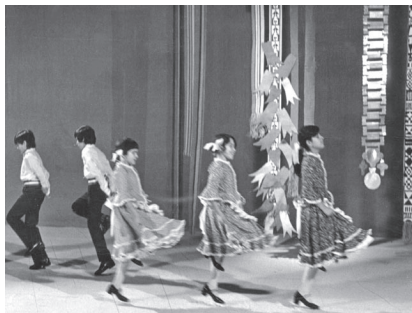
Fig. 3. Des enfants dansent pour l'émission Add a Kezed (Donne-moi la main)