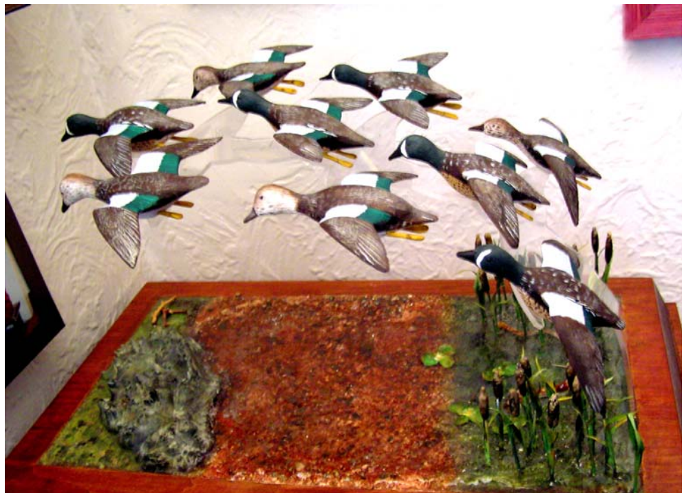
L'envolée de sarcelles à ailes bleues